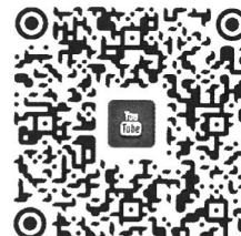
慧炬 YouTube 影音頻道